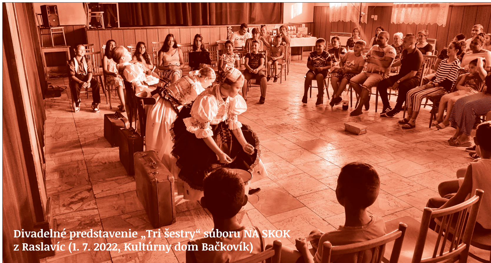
Divadelné predstavenie „Tri sestry“ súboru NA SKOK z Raslavíc (1. 7. 2022, Kultúrny dom Bačkovík)

Počas jednej z aprílových sobôt sme v našej obci opäť upratovali. Spolu sa nám podarilo zhromaždiť až 90