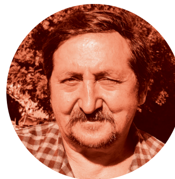
Autor: Andrej Jožka st. (dhoročný obyvateľ Rómskej osady)

„Starosta je síce mierne výbušný, ale tak ako každý jeden človek. Ale verím tomu, že je schopný robiť pre ľudí to najlepšie. Lebo to čo dokázal urobiť pre obec nedokázal ani jeden starosta.“ ■