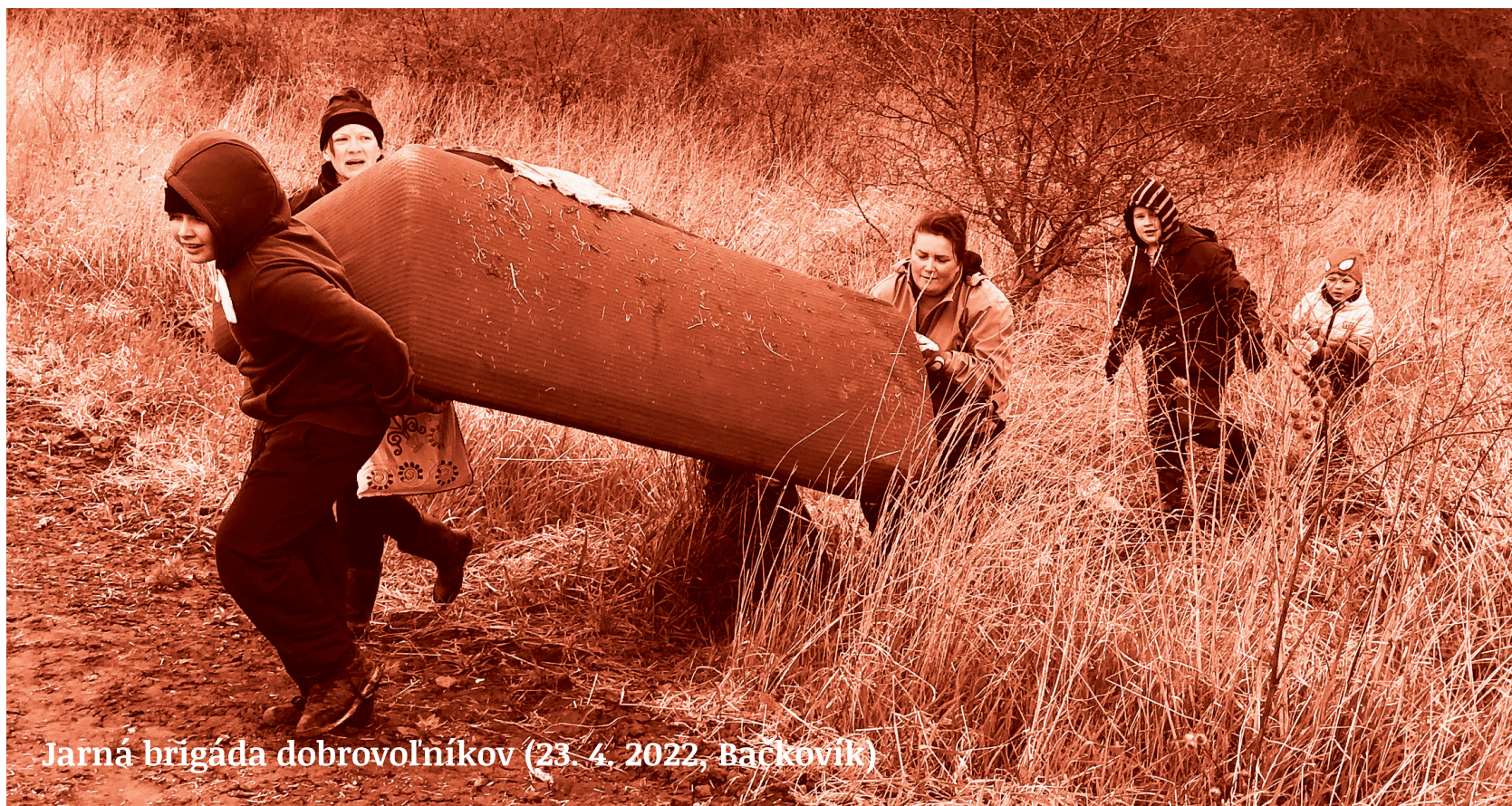
Jarná brigáda dobrovoľníkov (23. 4. 2022, Bačkovík)

Zaujímá vás nejaká konkrétna téma? Chcete do novín prispieť vlastným textom? O čom by sa malo v obecných novinách písať a v domácnostiach hovoriť? Dajte nám vedieť na: obecne.noviny@backovik.sk .