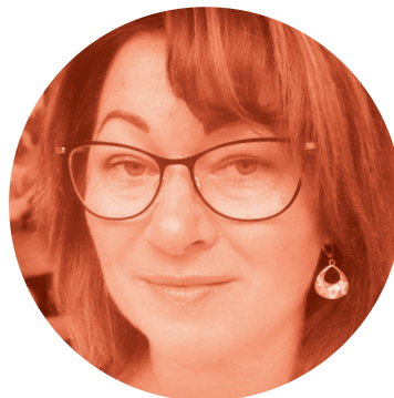
Autorka: Marta Ovadová (poslankyňa obecného zastupiteľstva)

Vyzdvihujem osobnosť te-rajšieho starostu – práve jeho zaniehanie, aktivitu, pracovnú nasadenosť pri zveľaďovaní obce, rozhladenosť vo všetkých smeroch a ciele plánovanie (naplánované projekty do budúcnosti sú reálne, treba na to len čas). Starosta zaviedol do obce informovanosť, ktorú si sami ľudia žiadali a po dlhšom čase aj poriadok. ■