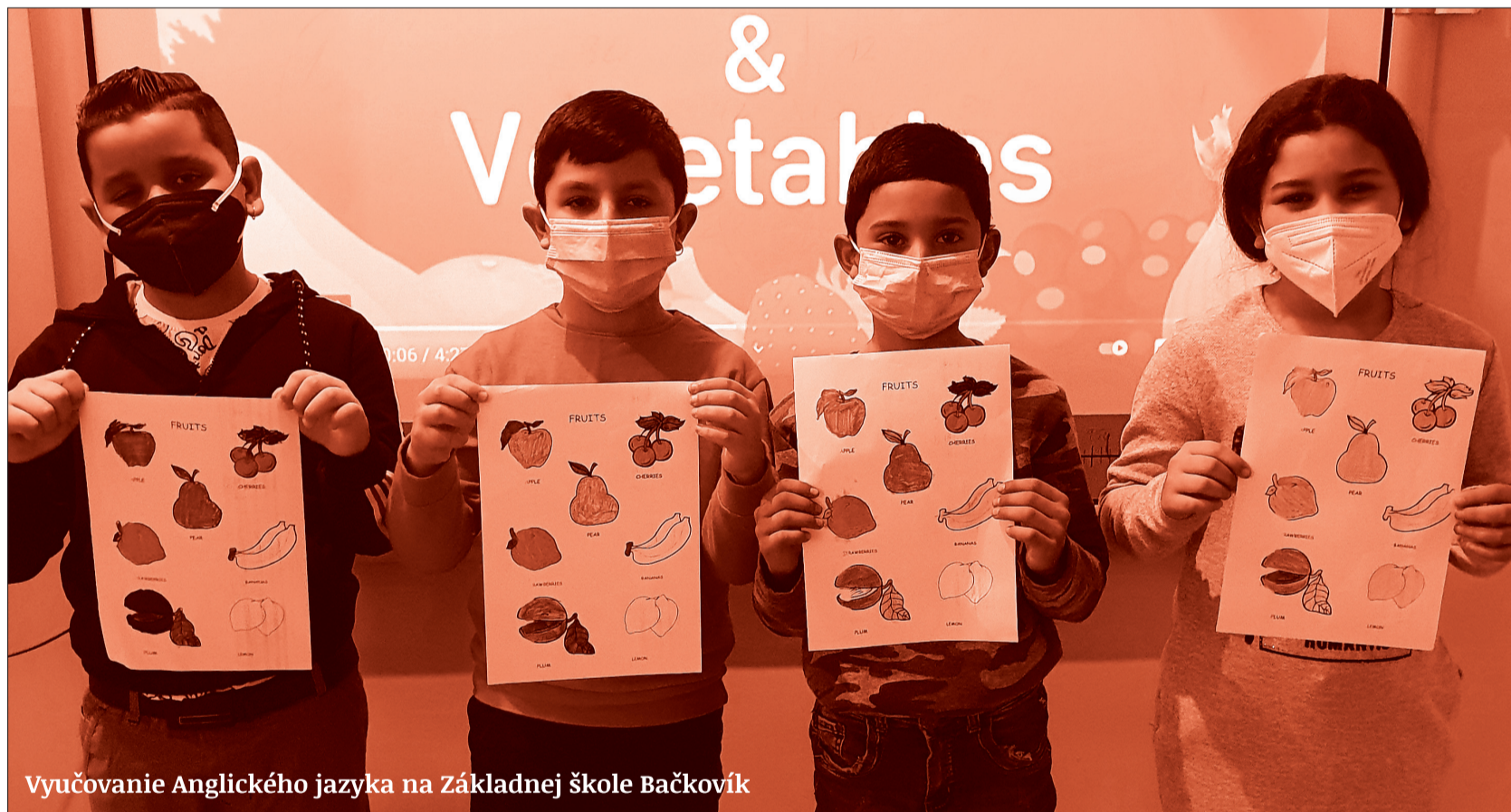
Vyučovanie Anglického jazyka na Základnej škole Bačkovík