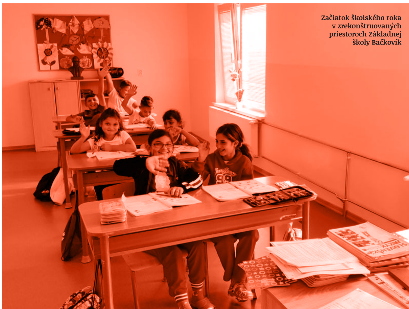
Začiatok školského roka v zrekonštruovaných priestoroch Základnej školy Bačkovík

Vzájomná ohľaduplnosť a rešpekt pomáha riešiť nezhody medzi obyvateľmi obce.