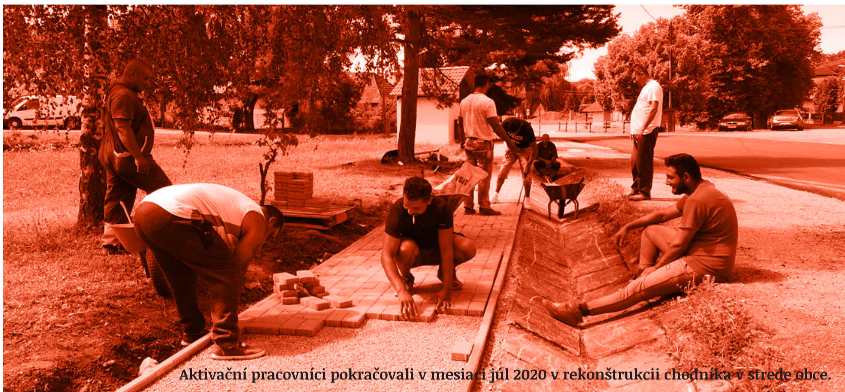
Aktivační pracovníci pokračovali v mesiaci júl 2020 v rekonštrukcii chodníka v strede obce.